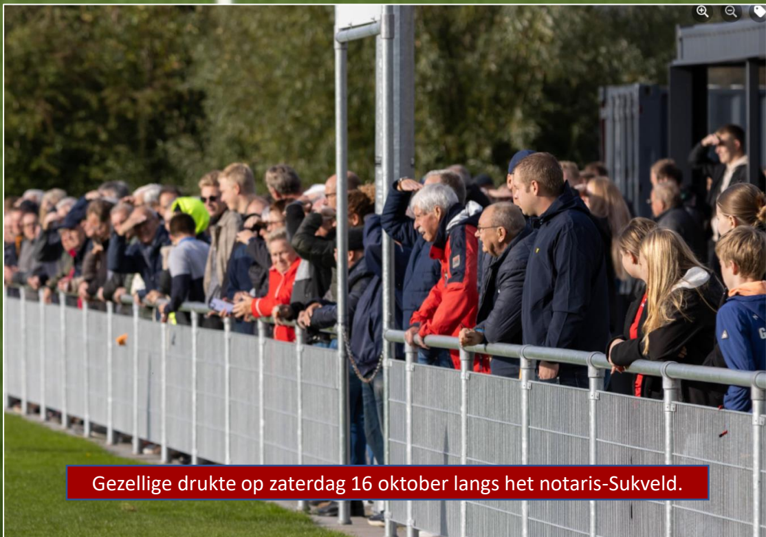
Gezellige drukte op zaterdag 16 oktober langs het notaris-Sukveld.